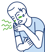
Vertiges / Nausées